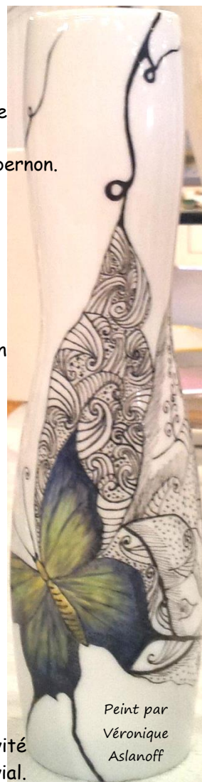
Peint par Véronique Aslanoff

Au fil des années de nouvelles activités se mettent en place dans un deuxième local, rue de la Tourraque. Aujourd'hui l'association offre une palette variée de loisirs manuels d'arts décoratifs, de loisirs culturels ou de détente. Les participants peuvent acquérir de nouvelles connaissances, mettre en oeuvre leur créativité et partager un moment convivial.